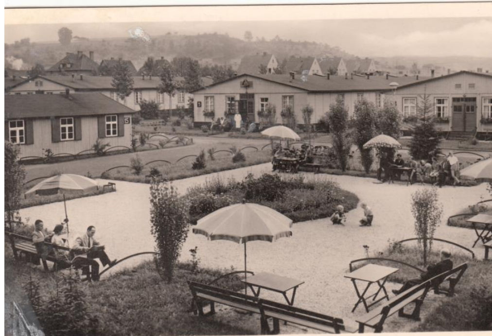
Grenzübergangslager Friedland bei Göttingen