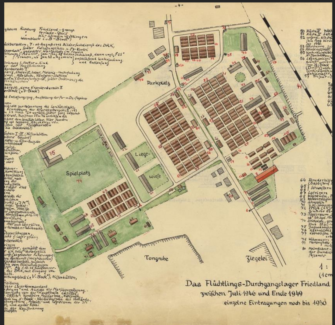
Das Grenzdurchgangslager 1945/ 46